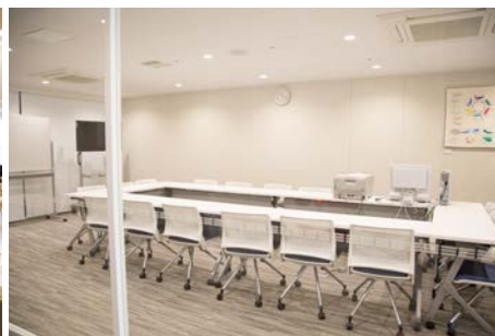
カンファレンスルーム